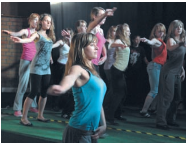
Die Tanz- und Theatergruppe der Konrad-Wachsmann-Schule hat sich bei jungbewegt mit dem Projekt „Kostümfundus“ beworben und überzeugte die Jury

Die Jury tat sich nicht leicht mit der Entscheidung. Die Projekte entsprachen alle dem Wettbewerbsansatz, demzufolge Engagement, Beteiligung und gute Ideen von Jugendlichen mit einem Umsetzungsgeld von max. 400,- Euro gefördert werden sollen. Nach zwei Stunden Präsentationsmarathon zogen sich die jungen Juror/-innen und Expert/-innen für Freiwilligenengage-